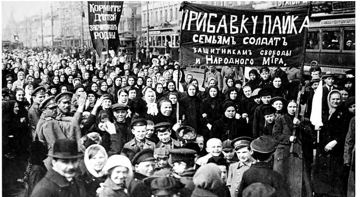
Las mujeres dando comienzo a la revolución de febrero

Frente a esta situación, el gobierno incrementó la represión, apelando a cuerpos militares menos influenciados por el pueblo. El 26 de febrero las fuerzas del zar ataca-