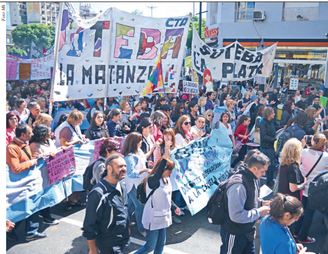
Los Sutebas opositores marchando en defensa de la educación pública

Llamamos a todos los trabajadores a apoyar la lucha docente.