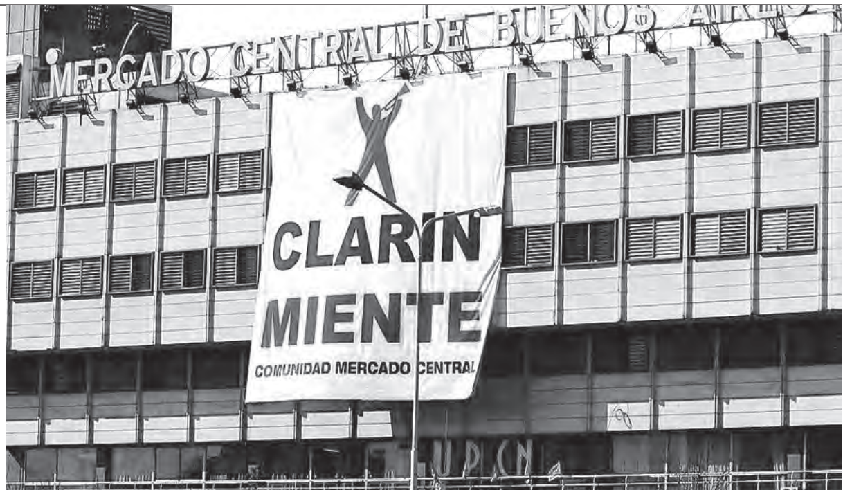
Cartel contra Clarín en el mercado central de Buenos Aires

Para combatir de verdad a los enemigos de la clase obrera, llamamos a los trabajadores y al pueblo a sacar conclusiones y abandonar al kirchnerismo y sumarse al Frente de Izquierda.