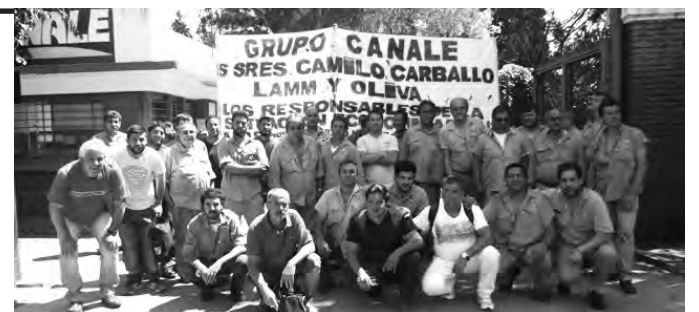
Trabajadores de Canale en lucha

En septiembre del 2016 asumió un nuevo cuerpo de delegados que ha venido impulsando desde entonces un plan de lucha votado en asamblea. Luego de tres meses de pelea, los trabajadores de Canale cobraron el mes de enero, y se firmó un acuerdo para cobrar los sueldos adeudados de noviembre y diciembre, con fecha