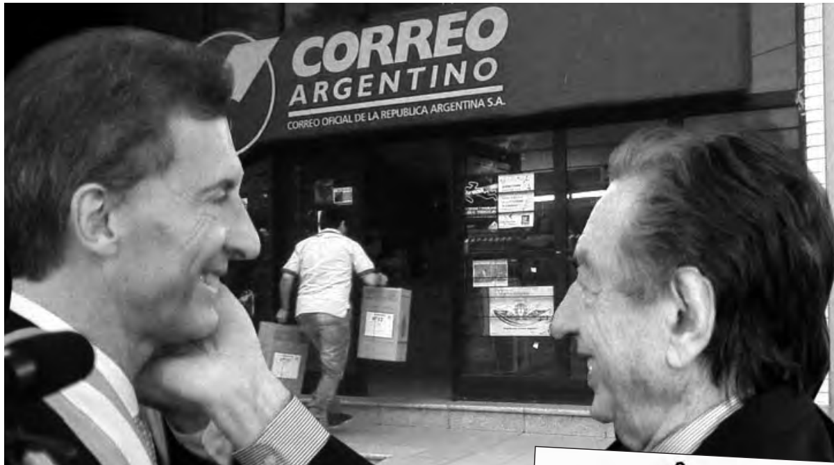
Todo queda en familia: los Macri padre e hijo

La turbia relación de la familia Macri con las arcas del estado se vio expuesta ante millones de personas con la última medida del gobierno: la quita de un 98.8% (70.000 millones de pesos) de la deuda contraída por el grupo Macri durante su administración de la concesión del Correo Argentino. El grupo empresarial de la familia Macri, que durante las décadas del 70 y el 80 había hecho jugosos negocios con la obra pública y la estatización de deudas privadas durante la dictadura, se apoderó en 1997 del Correo Argentino en el marco de las privatizaciones realizadas por Carlos Menem. En apenas cuatro años, los Macri redujeron la nómina de trabajadores en un 40%, despidiendo a más de ocho mil empleados y acumularon una deuda con el Estado de alrededor de 300 millones de dólares, al negarse a pagar el canon de la concesión entre 1998 y 2003 mientras obtenían aumentos de tarifas, vía libre para despedir y flexibilizar trabajadores y cuantiosas ventajas comerciales.