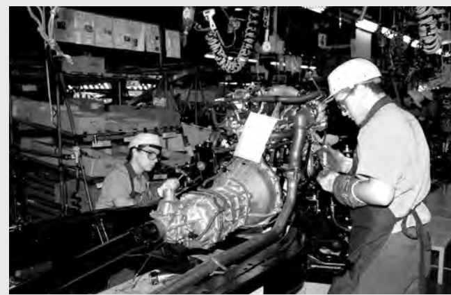
Gobierno y patronales quieren más flexibilización