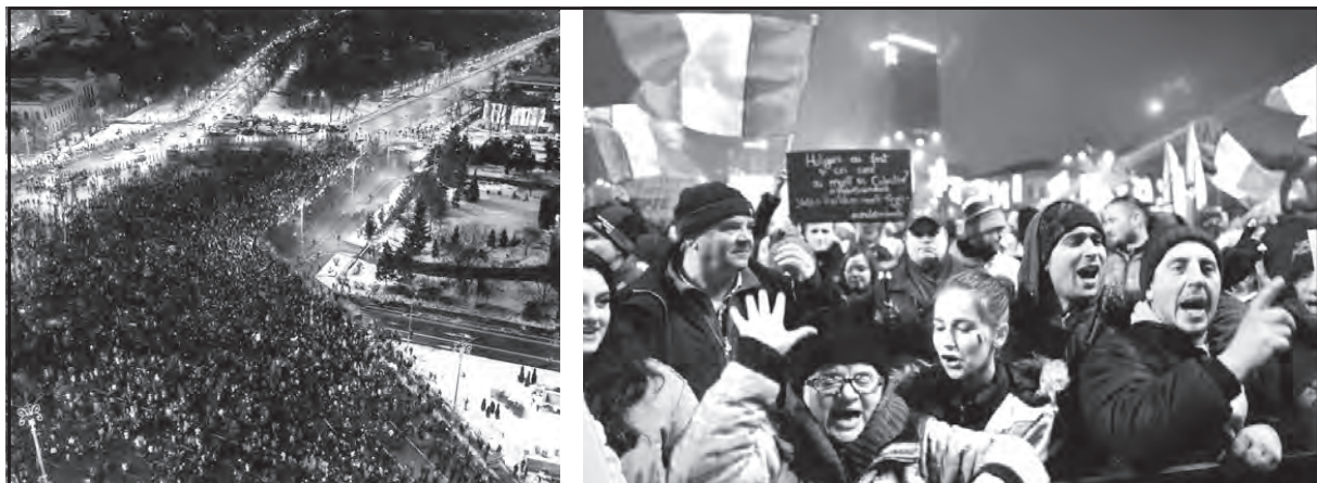
Cientos de miles protestan en las calles de Bucarest

herramientas y partes para todo el grupo Renault, con 13.000 obreros en varias plantas.